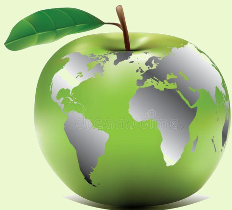
Виробництво яблук у господарствах усіх категорій