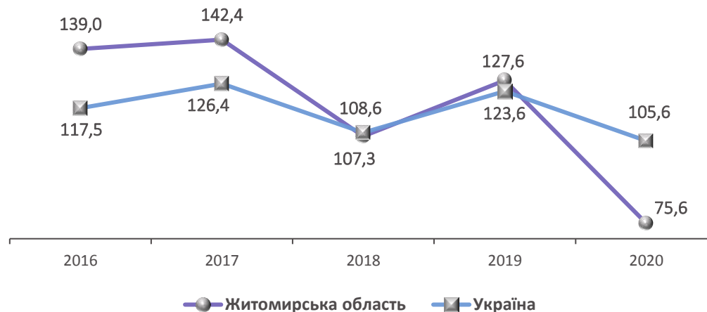
Розподіл обсягів виробленої будівельної продукції