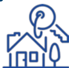
ТЕМП ЗРОСТАННЯ (ЗНИЖЕННЯ) ОБСЯГУ ЗАГАЛЬНОЇ ПЛОЩІ ПРИЙНЯТОГО В ЕКСПЛУАТАЦІЮ ЖИТЛА (у відсотках до відповідного періоду попереднього року)