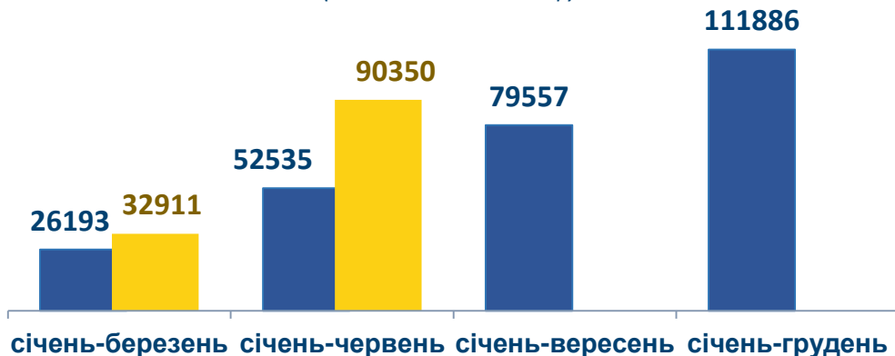
ЗАГАЛЬНА ПЛОЩА ЖИТЛОВИХ БУДІВЕЛЬ, ПРИЙНЯТИХ В ЕКСПЛУАТАЦІЮ (м 2 загальної площі)