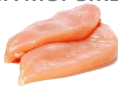
ФІЛЕ КУРЯЧЕ (кг)