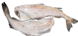
РИБА МОРОЖЕНА (кг)