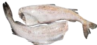
РИБА МОРОЖЕНА (кг)