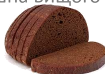
ХЛІБ ЖИТНІЙ, ЖИТНЬО-ПШЕНИЧНИЙ (кг)