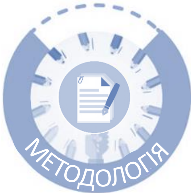
«ЗМІНИ ЦІН (ТАРИФІВ) НА СПОЖИВЧІ ТОВАРИ (ПОСЛУГИ)»

Формування показників здійснюється за результатами державного статистичного спостереження «Зміни цін (тарифів) на споживчі товари (послуги)», методологія якого враховує загальні вимоги Конвенції 160 Міжнародної організації праці 1985 року (стаття 12), Резолюції з питань індексів споживчих цін, прийнятої на сімнадцятій міжнародній конференції статистиків праці (2003), Регламенту (ЄС) № 2016/792 від 11 травня 2016 року, Виконавчого Регламенту Комісії (ЄС) № 2020/1148 від 31 липня 2020 року, а також «Керівництва щодо індексів споживчих цін: Поняття та методи», підготовленого Міжнародним валютним фондом, Міжнародною організацією праці, Статистичним бюро Європейської спільноти (Євростатом), Європейською економічною комісією Організації Об'єднаних Націй, Організацією економічного співробітництва і розвитку (ОЕСР) та Світовим банком (2020).