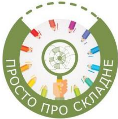
ІНДЕКС СПОЖИВЧИХ ЦІН