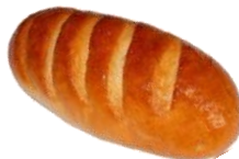
БАТОН (500 г)