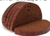
ХЛІБ ЖИТНІЙ, ЖИТНЬО-ПШЕНИЧНИЙ (кг)