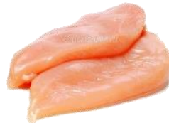
ФІЛЕ КУРЯЧЕ (кг)