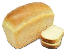
ХЛІБ ПШЕНИЧНИЙ з борошна вищого ґатунку (кг)