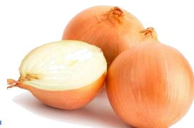
ЦИБУЛЯ РІПЧАСТА (кг)