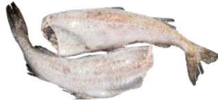
РИБА МОРОЖЕНА (кг)