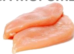
ФІЛЕ КУРЯЧЕ (кг)